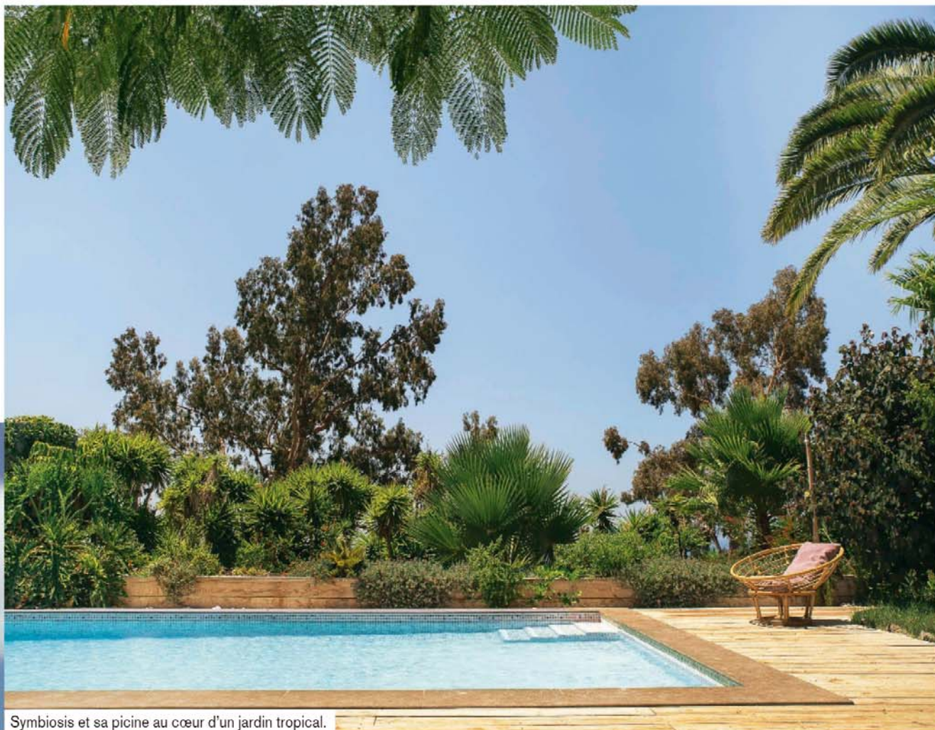
Symbiosis et sa piscine au cœur d'un jardin tropical.